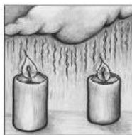
Zweiter Advent O Gott, ein' Tau vom Himmel gie