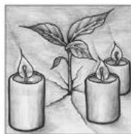
Dritter Advent O Erd, schlag aus, schlag aus, o Erd