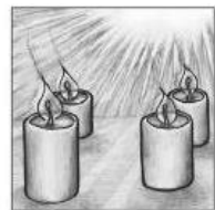
Vierter Advent O klare Sonn, du schner Stern