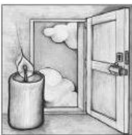
Erster Advent O Heiland, rei die Himmel auf

Samstag, 21. Dezember 18.00 Uhr Eucharistiefeier Sonntag, 22. Dezember 10.00 Uhr Wortgottesfeier